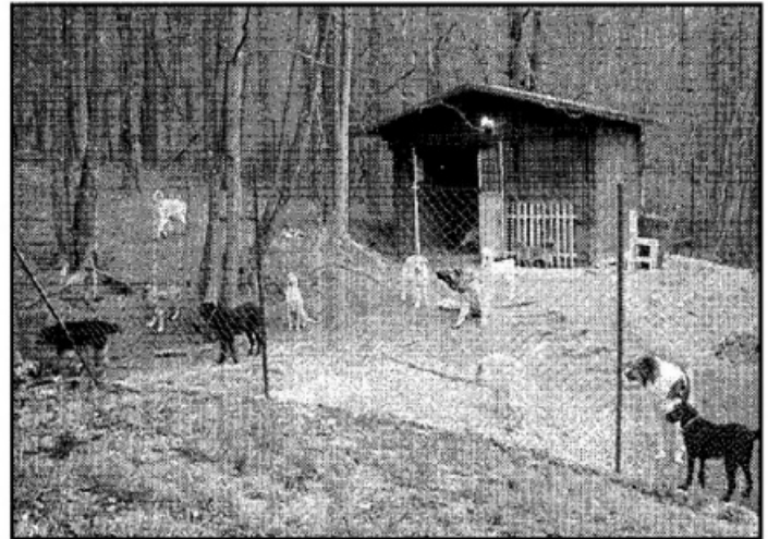
Rettungsstation am Attersee

Vor ein paar Jahren hat sich ein junges Ehepaar in einem kleinen, alten Bauernhaus in der Nähe des Sees niedergelassen und eine Hunderechtsstation aufgebaut. Die Vermittlung von Hunden an neue Besitzer in Österreich ist aber nur ein kleiner Teil der Arbeit, denn der Schwerpunkt liegt in der Hilfe vor Ort - vor allem im Osten Europas.