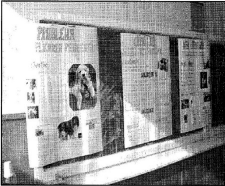
„Hundeunterricht“ in Schulen

Ein Teil der Hunde darf in eine der sieben Rettungsstationen kommen, dort bekommen sie täglich Futter, tierärztliche Verpflegung und vor allem Zuwendung und können von lieben Menschen adoptiert werden.